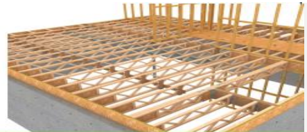
Système de plancher ajouré