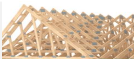
Fermes de toit

Nous sommes ouverts aux emplois étudiants.