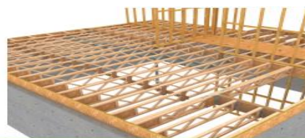
Système de plancher ajouré

Si vous êtes intéressé(e)s, veuillez envoyer votre CV à l'adresse suivante : mathieu.cote@ebarrette.com